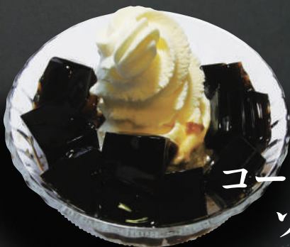
コーヒーゼリー& ソフトクリーム 420円