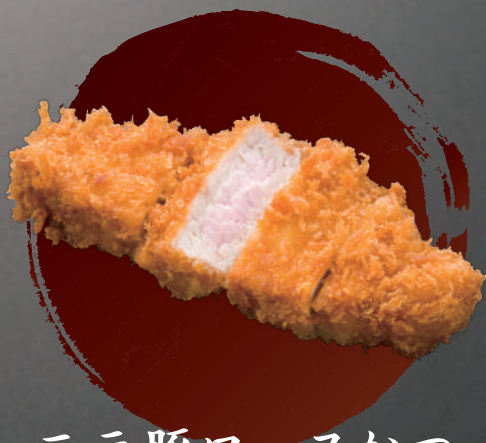
三元豚ロースかつ 85g 440円