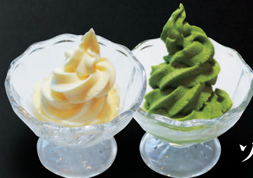
ソフトクリーム (バニラor抹茶) 290円