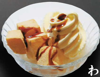
わらび餅ソフト 330円