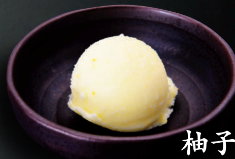
柚子シャーベット 110円