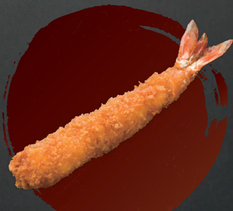
特上海老フライ 1本 830円