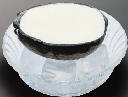
ココナッツ アイス 390円