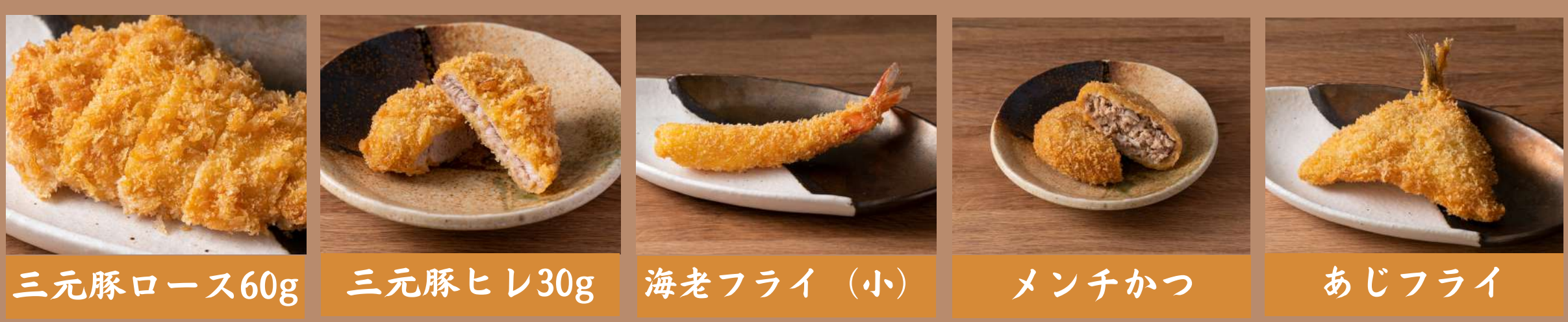
三元豚ロース60g 三元豚ヒレ30g 海老フライ (小) メンチかつ あじフライ